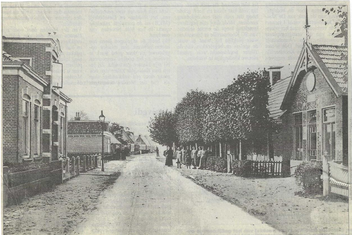
Ansichtkaart van de Buorren van Drogeham omstreeks 1915.